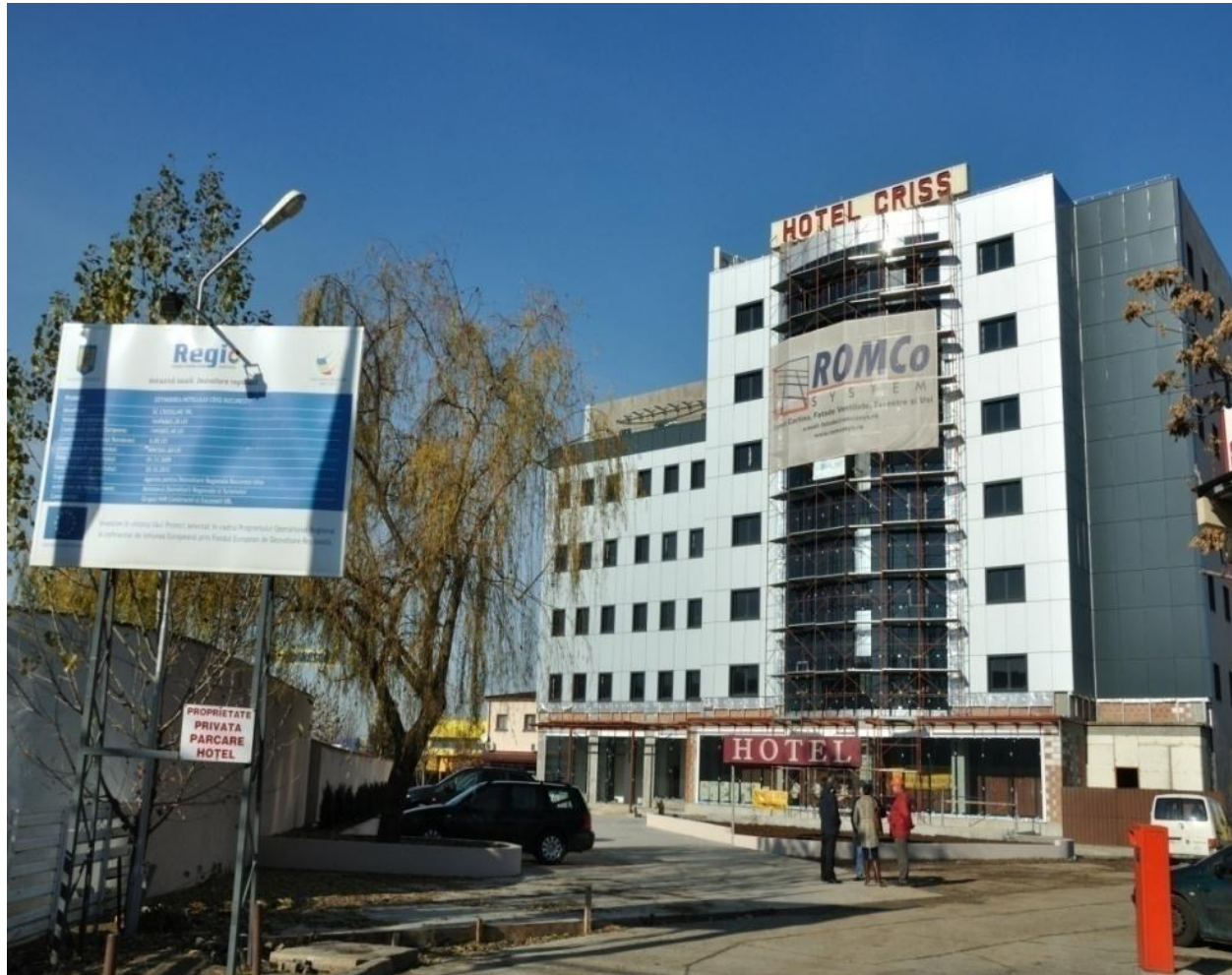
Hotel CRISS - sector 6, București